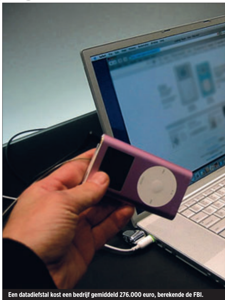
Een datadiestaf kost een bedrijf gemiddeld 276.000 euro, berekende de FBI.

In een gemiddeld bedrijf circuleren op het interne netwerk heel wat vertrouwelijke documenten: van cijfers over blauwdrukken tot geheime productieprocessen. De Amerikaanse federale politie FBI stelde onlangs dat diefstal van intellectuele eigendom de op drie na grootste economische impact op